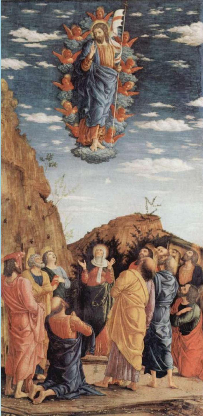
Andrea Mantegna, Ascensione di Cristo . Trittico degli Uffizi (part.), 1460 ca.

La montagna è il simbolo esoterico dell' unione degli opposti (luce/ombra, maschile/femminile, negativo/positivo, materiale/immateriale, pieno/vuoto, finito/infinito) e di ascensione al cielo: